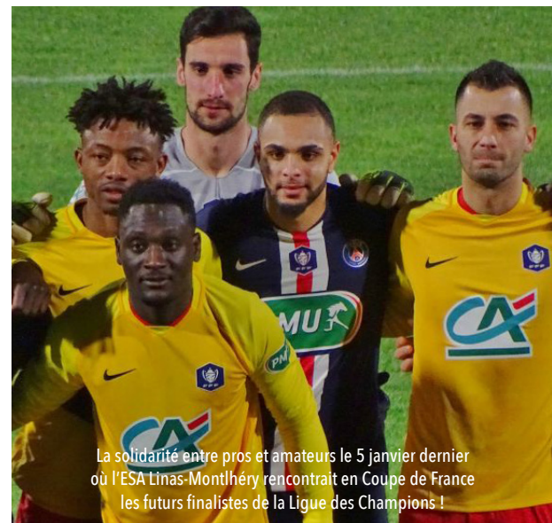
La solidarité entre pros et amateurs le 5 janvier dernier où l'ESA Linas-Montlhéry rencontrait en Coupe de France les futurs finalistes de la Ligue des Champions !

Nous nous sommes tous retrouvés avec des poules au nombre impairs et nous avons tous décidé de les garder en l'état sachant que si nous les avions complétées il y aurait eu plus de relégations au terme de la saison 2020-2021. De la même façon nous avons décidé de tous faire preuve de bienveillance envers les arbitres qui n'avaient pas eu la possibilité de faire le nombre de matches voulus. »